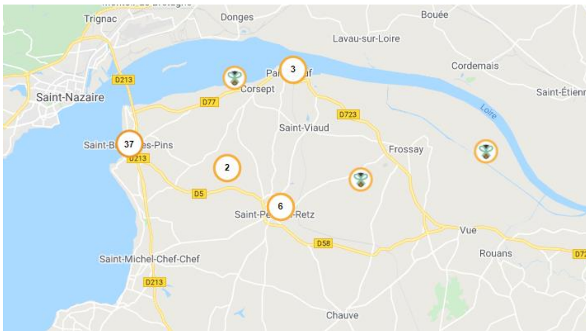
Localisation des 51 commerces participants à l'opération bon d'achat Beegift

Toutes les informations sont à retrouver sur le site Beegift